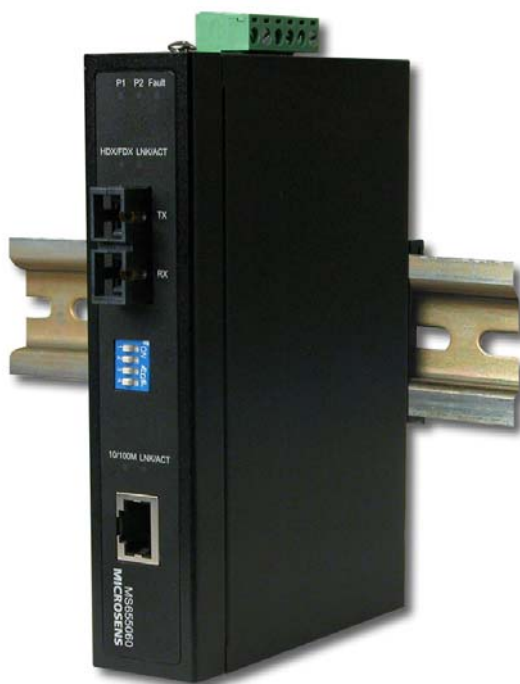
Fig. 1: Entry Line Bridge Fast Ethernet

Tous ces nouveaux produits sont très simples d'installation et mise en service (Plug&Play) et ne nécessitent pas de configuration. Ils ont été développés pour répondre au besoin en nombre de ports plus élevé et en vitesse plus élevée (Gigabit Ethernet).